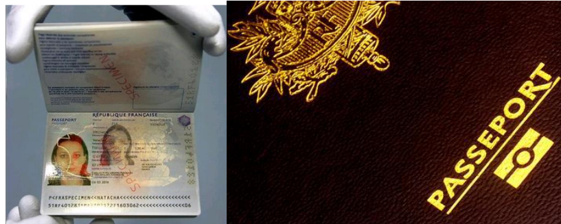
Photo reproduite 2 fois sur la même page.

Sous le mot passeport, se trouve un symbole sécurisé (cercle à l'intérieur d'un rectangle).