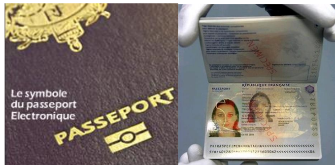
Photo reproduite 2 fois à l'intérieur du passeport.

Sous le mot passeport, se trouve un symbole sécurisé (cercle à l'intérieur d'un rectangle).